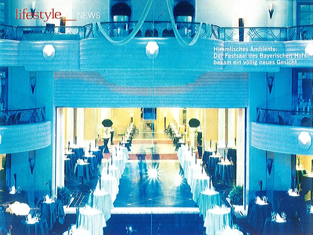
Himmliches Ambiente: Der Festsaal des Bayerischen Hofes bekam ein völlig neues Gesicht